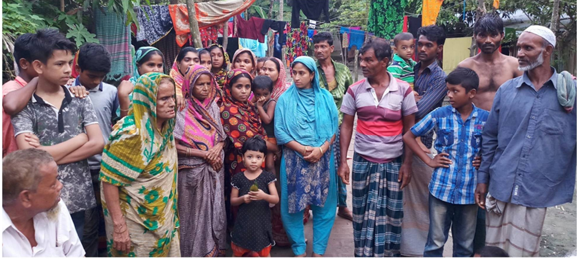
All groups of people living in the cluster village of Bhola (Bangladesh) are talking about the vulnerable situation of their WASH facilities

সারণি ১: অ্যাডভোকেসি পরিকল্পনার জন্য যৌক্তিক কাঠামোর একটি উদাহরণ