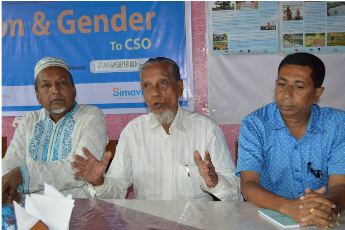
জেন্ডার, অন্তর্ভুক্তিকরণ, ওয়াশ এবং আইডব্লিওআরএম বিষয়ক কোচিং সেশন

সমন্বিত আলোচনার পর, প্রশিক্ষককে আলোচনার প্রধান ধারণা এবং সারমর্ম সংক্ষিপ্তাকারে ব্যক্ত করার চেষ্টা করা উচিত।