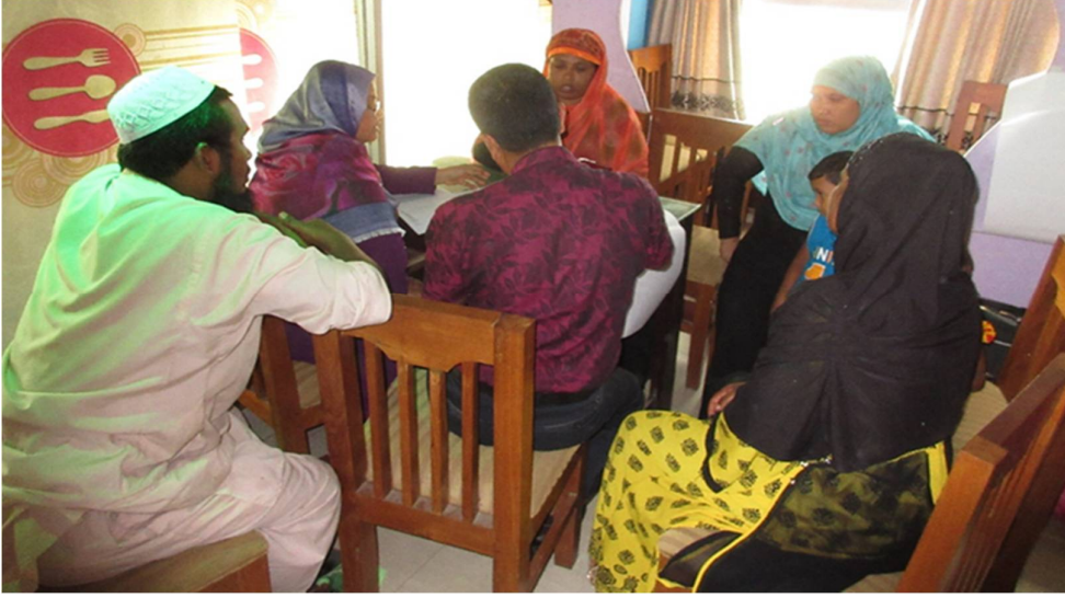
অন্তর্ভুক্তিকরণমূলক অ্যাডভোকেসি পরিকল্পনার জন্য দলগত কাজ